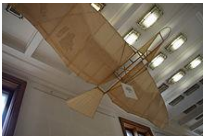
Replika lotni Czesława Tańskiego w Muzeum Techniki w Pałacu Kultury i Nauki w Warszawie

W latach 1905-1907 Tański zainteresował się śmigłowcami. Po udanych próbach z modelami, w 1907 zbudował prototyp śmigłowca (nazwanego śrubowcem), o dwóch przeciwbieżnych dwułopatowych wirnikach napędzanych siłą mięśni za pomocą korby. Nieudane próby z 1908 wykazały, że siła mięśni jest niewystarczająca do podniesienia go w powietrze. W 1909 Tański zamontował na swoim śmigłowcu dwucylindrowy silnik spalinowy Anzani o mocy 2,5 KM. Z powodu braku chłodzenia i małej mocy silnik przegrzewał się, a uniesienie człowieka wciąż nie było możliwe. Śmigłowiec ten nie miał ponadto przyrządów sterowniczych. Po tym niepowodzeniu Tański zaprzestał prób ze śmigłowcem, który w 1934 został również przekazany do zbiorów Muzeum Przemysłu i Rolnictwa w Warszawie i tam uległ zniszczeniu podczas powstania warszawskiego, kiedy muzeum spłonęło.